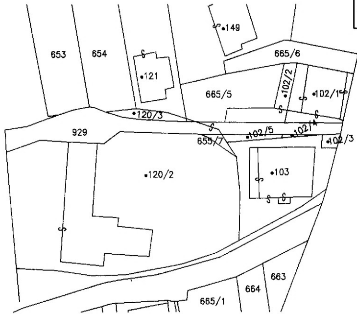
ESTRATTO DI MAPPA 1 : 1000